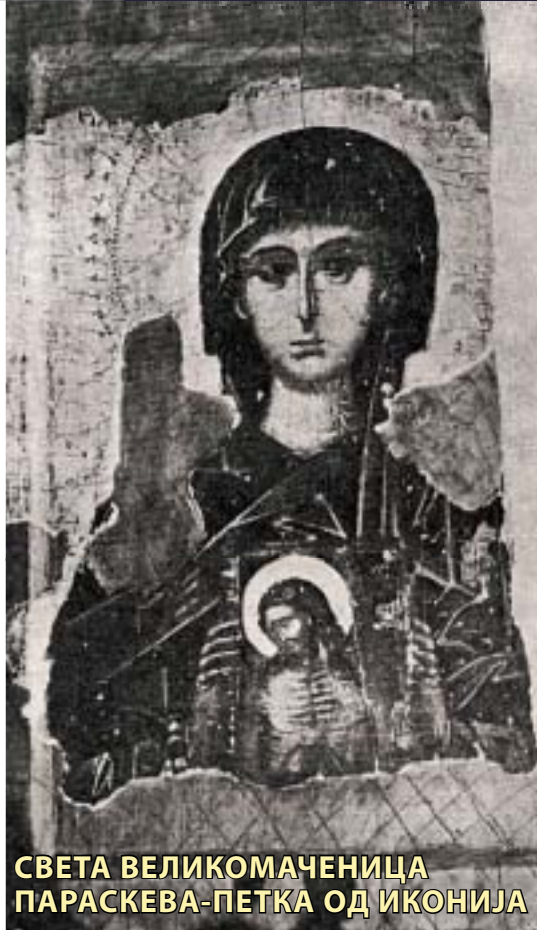
СВЕТА ВЕЛИКОМАЧЕНИЦА ПАРСКЕВА-ПЕТКА ОД ИКОНИЈА

На 10 ноември не можеме а да не се сетиме на страдањата на милосрдната девојка, со сонцезрачна убавина, со чист разум и со света душа, Света Великомаченица Параскева-Петка, од Иконија. За време на царот Диоклецијан, обвинета од незнајбожните граѓани, дека верува и го проповеда Распнатиот Христос, била изведена на суд пред кнезот на таа земја. Ја озари Светиот Дух и нејзиното мило лице стана светло. Со чисто срце во кое го носеше Христа, светата девојка пред кнезот на судот одговара: "...Името на вечниот живот ми е: христијанка, слугинка Христова, а името на мојот привремен живот е Параскева". По наредба на мачителот, била тепана со сирови жили. Ја обесиле на дрво и со железни нокти ѝ ги дереле ребрата, а со крии ѝ ги триеле раните. На тој начин ѝ го одрале месото сè до самите коски. Потоа ја симнале од дрвото и ја фрлиле во темнина. Таму ѝ се јавил ангелот Божји и ја излекувал од раните. Со молитва ги разурнала идолите во незнајбожниот храм. Тогаш кнезот наредил ребрата да ѝ ги палат со оган. Но, и тие мачења ги издржала. На крај кнезот наредил со меч да биде исечена. Кога ѝ ја отсекле главата, небото прозборело: "Радувајте се праведни, зашто се венчава маченицата Параскева!"