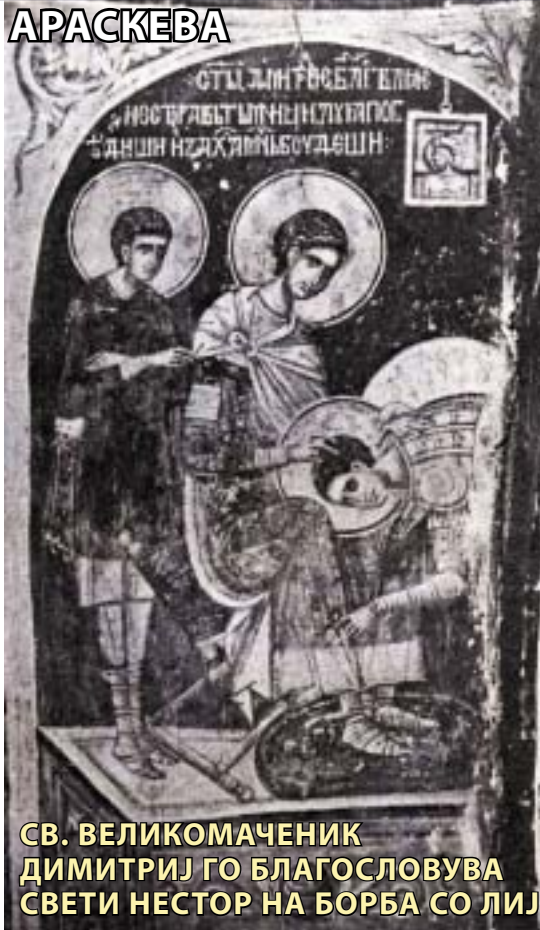
СВ. ВЕЛИКОМАЧЕНИК ДИМИТРИЈ ГО БЛАГОСЛОВУВА СВЕТИ НЕСТОР НА БОРБА СО ЛИЈ