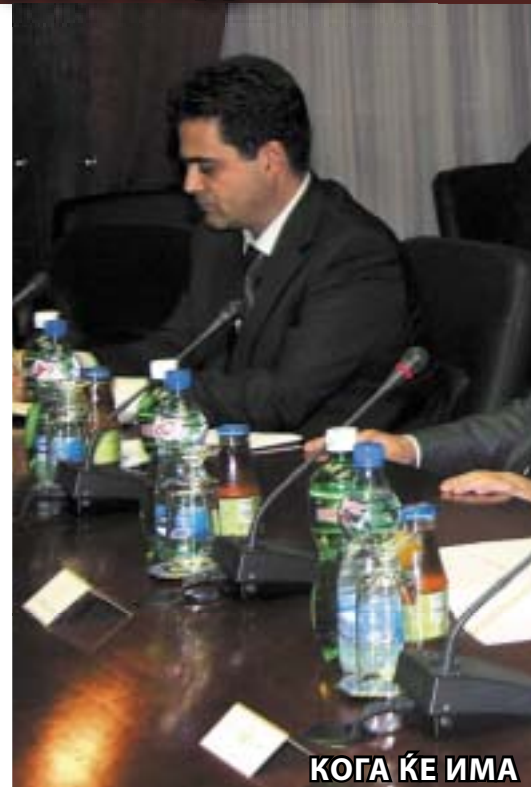
КОГА ЌЕ ИМА

В о последно време сè почесто во Македонија се случуваат напади врз полициски станици или патроли во кои гинат припадници на МВР, доаѓа до пресметки меѓу криминални банди со извесна политичка провиниенција, се пласираат закани за референдум за отцепување на делови од државната територија, се регистрира појава на паравоени групи на границата кон Косово, се напаѓаат цивилни лица на кои им се врежуваат ознаките на УЧК, што заедно со заканите на ДУИ за излегување од Собранието на Македонија или изјавите на нејзините градоначалници дека за нив е валиден Законот за употреба на знамињата на заедниците во РМ, претставуваат сериозни индиции кои и на најслабата разузнавачка служба во светот ќе ѝ послужат како основа за алармирање на највисокото државно раководство дека со земјата се одвива сценарио за дестабилизација на состојбите или за создавање нова криза која треба да биде разврска на проблемот со Косово. Само наивен човек би помислил дека сè тоа е резултат на некоја спонтаност во вечното тркало на политичките случувања и турбуленции, особено ако тие настани