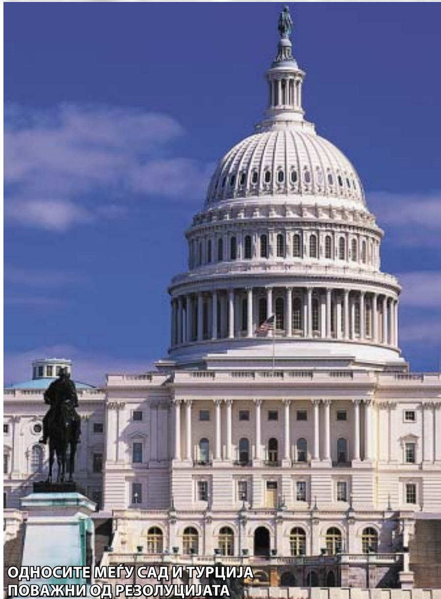
ОДНОСИТЕ МЕЃУ САД И ТУРЦИЈА ПОВАЖНИ ОД РЕЗОЛУЦИЈАТА