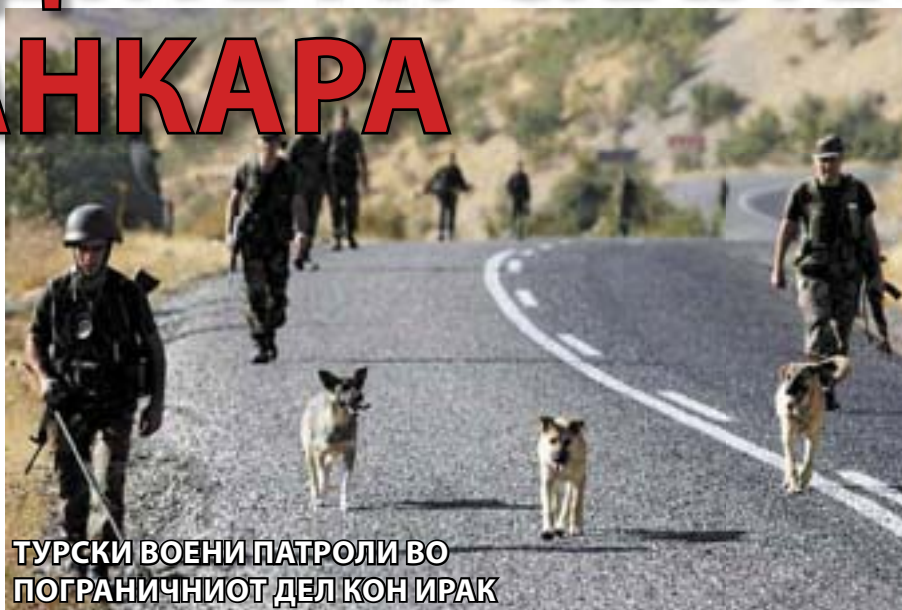
ТУРСКИ ВОЕНИ ПАТРОЛИ ВО ПОГРАНИЧНИОТ ДЕЛ КОН ИРАК