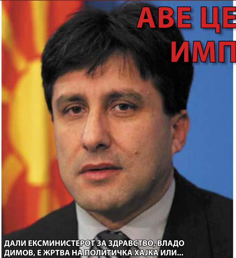
ДАЛИ ЕКСМИНИСТЕРОТ ЗА ЗДРАВСТВО, ВЛАДО ДИМОВ, Е ЖРТВА НА ПОЛИТИЧКА ХАЈКА ИЛИ...