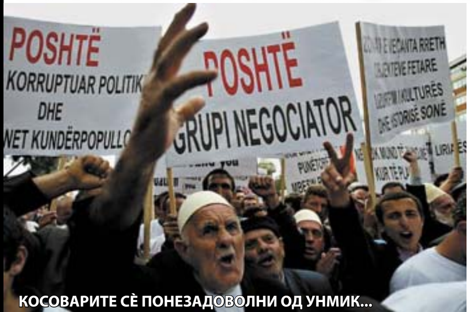
КОСОВАРИТЕ СЕ ПОНЕЗАДОВОЛНИ ОД УНМИК...

К осово тоне во бездната. Не само што никој не му подава рака за да го спаси, туку го поттурнуваат побрзо да падне во бунарот без дно. Истите оние кои секојдневно се декларираат дека ќе го спасуваат од хаосот и од безредието, се тие кои го водат во насока на потполна самоизолација и бесперспективност. Косово го уништуваат самопрогласените спасувачи, Косово го дотолчуваат странските естаблишменти кои се дојдени таму како гастербајтери, а не како дипломати. Доцна е нештата да се поправат. Кра-