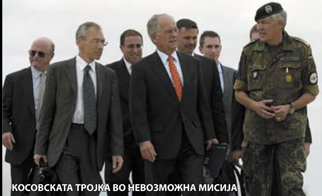
КОСОВСКАТА ТРОЈКА ВО НЕВОЗМОЖНА МИСИЈА