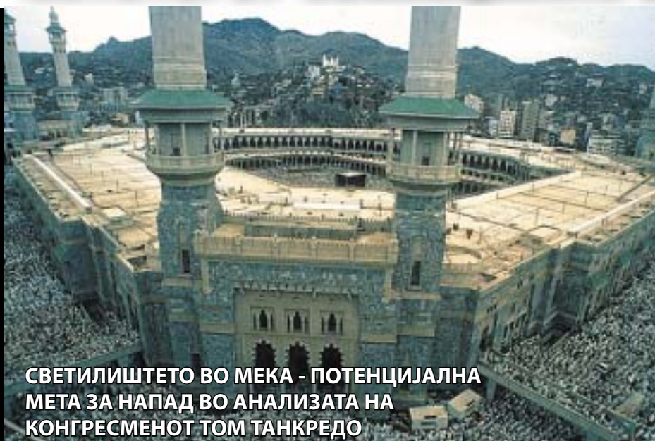
СВЕТИЛИШТЕТО ВО МЕКА - ПОТЕНЦИЈАЛНА МЕТА ЗА НАПАД ВО АНАЛИЗАТА НА КОНГРЕСМЕНОТ ТОМ ТАНКРЕДО