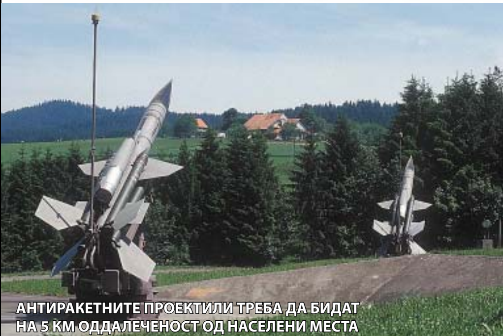
АНТИРАКЕТНИТЕ ПРОЕКТИЛИ ТРЕБА ДА БИДАТ НА 5 КМ ОДДАЛЕЧЕНОСТ ОД НАСЕЛЕНИ МЕСТА

Напуштањето на договорот доаѓа во момент кога од паѓањето на Берлинскиот ѕид односите меѓу Истокот и Западот се на најниското ниво досега. Сепак, старите сојузници од западниот свет и по ова прашање остануваат заедно и