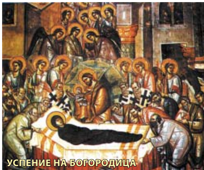
УСПЕНИЕ НА БОГОРОДИЦА

"Dojdi Bliska moja, dojdi Gulabice moja, dojdi najskapocen moj Biser, i vlez i vo `iveali {teto na ve-niot `ivot".