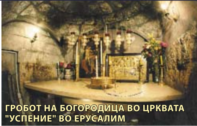
ГРОБОТ НА БОГОРОДИЦА ВО ЦРКВАТА "УСПЕНИЕ" ВО ЕРУСАЛИМ

ко Исусова, Која Му даде живот на нашиот Спасител и Господ, прозбори со Твоето срце, кажи му на светот, што почувствува Твојата душа, кога по еднаесет години разделба, Го виде жив саканиот Твој Син, Твојот Син Единец? Колку се израдува Твојот Свет Дух во Бога? Загледувајќи го приближувањето на Синот, Божјата Мајка радосно воскликнала: "Мојата душа го велича Господа, и мојот дух се зарадува во Бога, Спасителот мој..." Таа се подигнала од одарот, како да оди во пресрет на Својот Син и Му се поклонила на Својот Бог. А Тој, приближувајќи се и со неизмерна синовска љубов, гледајќи на Неа, рекол: "Дојди Блиска моја, дојди Гулабице моја, дојди најскапоцен мој Бисер, и влезе во живеалиштето на вечниот живот".