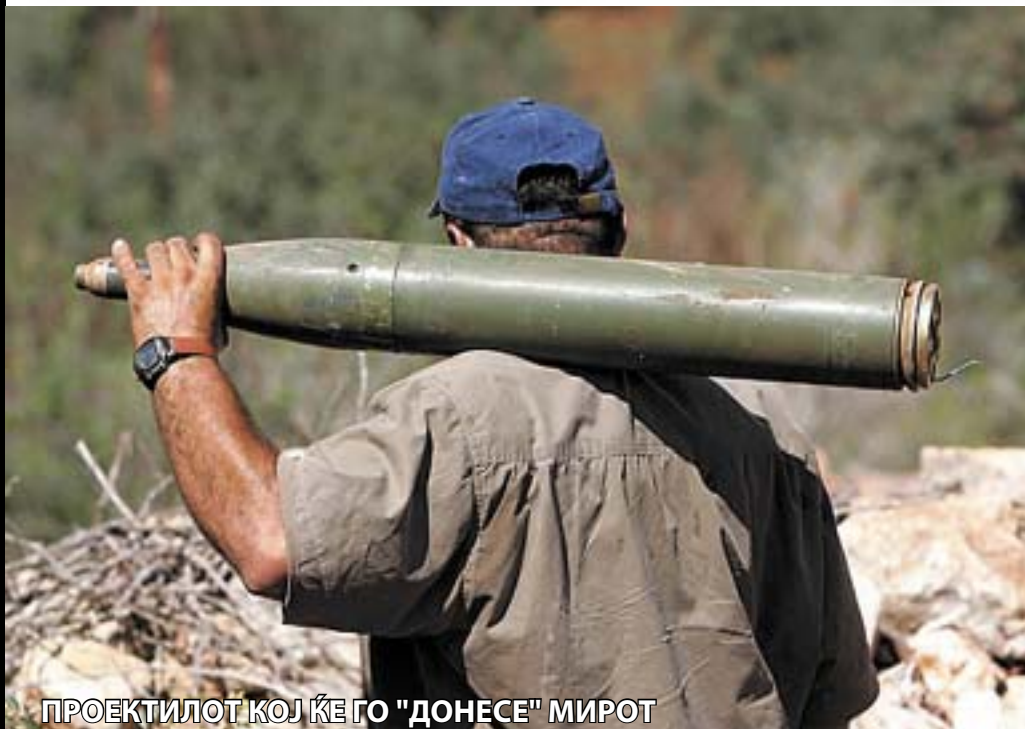
ПРОЕКТИЛОТ КОЈ ЌЕ ГО "ДОНЕСЕ" МИРОТ

Станува сè појасно дека кога доаѓа почетокот на предизборната кампања кај големите сили, пред сè, САД, Велика Британија и Руската федерација, неизбежни се нови светски кризи. Опаднатите рејтинзи на администрациите во нивните политички центри мора да се подигнат со нов воен зафат на некоја критична точка во светот. Во минатото тоа беа Виетнам, Босна, Косово, Ирак, Авганистан, Чеченија... Полека но сигурно се приближуваат изборите во Америка и во Русија, кои по обичај го привлекуваат најголемото внимание на светската јавност. Исходот од изборот во Белата кука или во Кремљ ќе биде пресуден не само за иднината на американската, односно на руската држава, туку за целата планета Земја. Оттука, во наредниот период можат да се очекуваат разно-разни нешта на геополитичката сцена - од создавање нови држави до инсценирање нови конфликти во