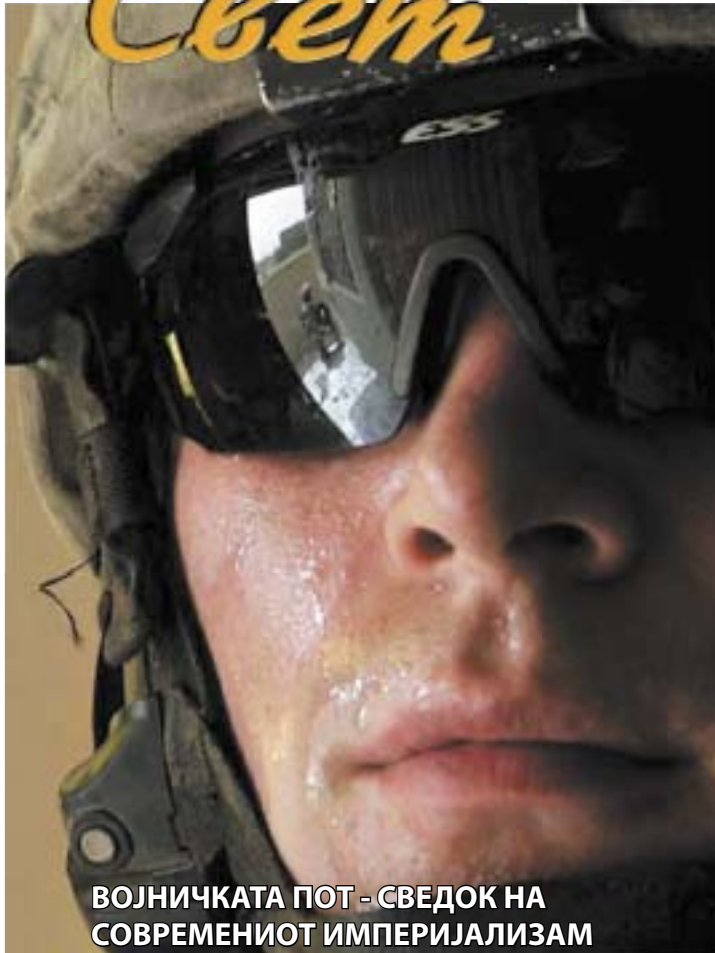
ВОЈНИЧКАТА ПОТ - СВЕДОК НА СОВРЕМЕНИОТ ИМПЕРИЈАЛИЗАМ

Приказните за демократија опишувани од страна на големите сили, по завршувањето на војните, повеќе не важат. Тогаш се покажува нивната вистинска слика. Наравоучението е поразително. Но, затоа, пак, се менуваат ликовите на еврата и на доларите. Добиваат посјајна боја, имаат поголема тежина, знаат да го променат светот. По секоја војна богатиот станува уште побогат, сиромавиот уште посиромашен. Нови работни места за изградба на разурнатото, евтина работна снага која ќе им донесе леб на страдалниците, но затоа, пак, ќе се родат нови комерцијални корпорации водени од магнати, кои профитирале од крвта на невините.