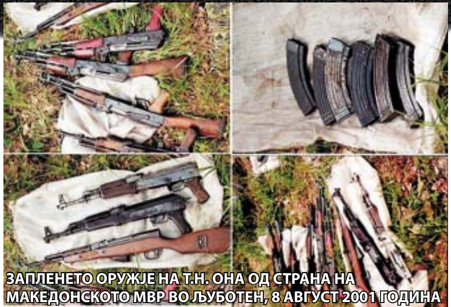
ЗАПЛЕНЕТО ОРУЖЈЕ НА Т.Н. ОНА ОД СТРАНА НА МАКЕДОНСКОТО МВР ВО ЉУБОТЕН, 8 АВГУСТ 2001 ГОДИНА

чале во редовите на т.н. ОНА во село Љуботен. Ова само ја потврдува тезата дека во Љуботен имало големо присуство на паравојската на ОНА и ги демантира наводите на Хашкото обвинителство дека во август 2001 година селото не се користело како база за изведување напади. Доказ за тоа е злосторничкиот потфат на борците на Али Ахмети, кои подметнале мина во месноста Љуботенски Бачила, кога загинаа осуммина припадници на македонската војска. Овој терористички акт претходно бил подготвен и организиран од страна на т.н. ОНА. Главен организатор