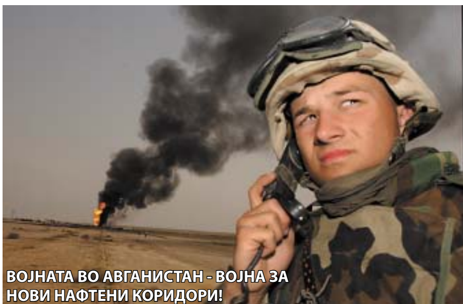
ВОЈНАТА ВО АВГАНИСТАН - ВОЈНА ЗА НОВИ НАФТЕНИ КОРИДОРИ!

Азија и нејзините богатства. Последните пет години Русија се обидува да го врати своето влијание во постсоветскиот простор, па оттука играта меѓу големите сили не само што станува поинтересна, туку и понеизвесна. На американско-европските комбинации Москва се спротивстави со изградбата на