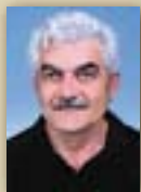
Пишува: Драги ИВАНОВСКИ

Основните цели на "Мировниот корпус" се содржат во обезбедувањето доброволци кои ќе дадат свој придонес во развојот на заинтересираните земји преку размена на искуства и информации, да им помогне на луѓето од земјите-домаќини да имаат подобро разбирање за луѓето од САД, како и да им помогне на Американците да се здобијат со повеќе познавања и разбирање на народите во светот.