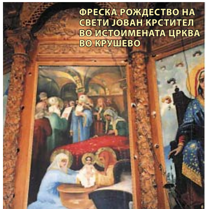
ФРЕСКА РОЖДЕСТВО НА СВЕТИ ЈОВАН КРСТИТЕЛ ВО ИСТОИМЕНАТА ЦРКВА ВО КРУШЕВО

е познато дека првосвештеникот Захариј и Елисавета, неговата жена, биле многу стари и бесчедни. И покрај тоа, Ангелот го објавил раѓањето на Свети Јован Крстител. Еве како светиот Евангелист Лука ни пишува за тоа: "Во деновите на Ирод, царот Јудејски, живееше еден свештеник по име Захарија, од редот Авијанов; а жена му беше од ќерките Аронови и