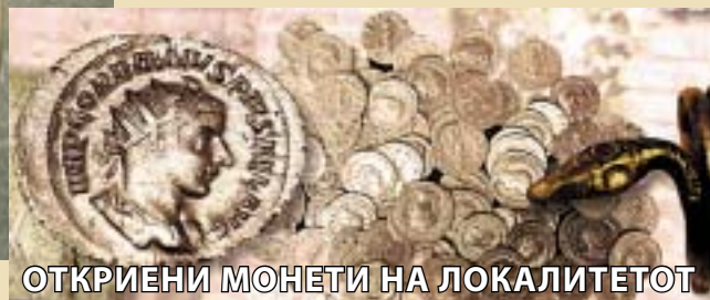
ОТКРИЕНИ МОНЕТИ НА ЛОКАЛИТЕТОТ

потоа да се реши што да се прави со нив и на кој начин тоа да се направи. Ние сме тука да дадеме совет, да дискутираме. Се надевам дека ќе донесеме заклучоци кои ќе бидат вредни за сите". Истражувањата кои годинава се финансирани само од "ЧИСС" од Палермо, без учество на македонското Министерство за култура (кое годинава, воопшто и не финансира истражувања на Стоби), ќе продолжат и во втората половина на