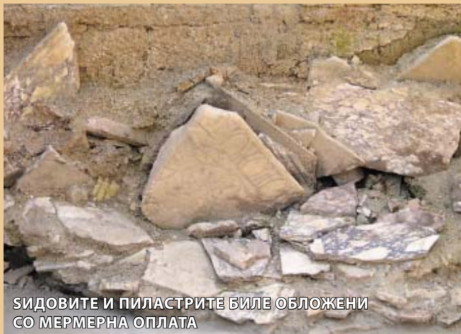
СИДОВИТЕ И ПИЛАСТРИТЕ БИЛЕ ОБЛОЖЕНИ СО МЕРМЕРНА ОПЛАТА

"Се надевам дека со новите сознанија ќе го оправдаме проектот и ќе продолжиме да работиме заедно и во рамките на културниот туризам ќе ѝ го претставиме Стоби на светската јавност".