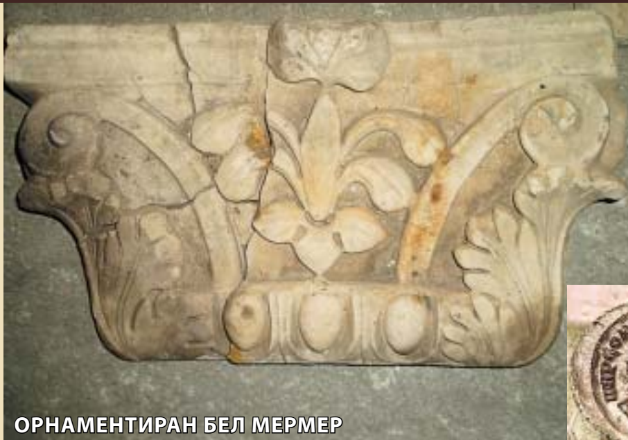
ОРНАМЕНТИРАН БЕЛ МЕРМЕР

потоа да се реши што да се прави со нив и на кој начин тоа да се направи. Ние сме тука да дадеме совет, да дискутираме. Се надевам дека ќе донесеме заклучоци кои ќе бидат вредни за сите". Истражувањата кои годинава се финансирани само од "ЧИСС" од Палермо, без учество на македонското Министерство за култура (кое годинава, воопшто и не финансира истражувања на Стоби), ќе продолжат и во втората половина на