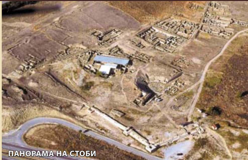
ПАНОРАМА НА СТОБИ

Со откривањето на монументален отворен влез, составен од три столба на врвот споени со аркади, завршува првата етапа од ископувањата кои веќе трета година ги финансира организацијата "ЧИИЗ" од Палермо, Италија, во рамките на проектот "Археолошка и туристичка валоризација на античкиот град Стоби". Римскиот форум на археолошкиот локалитет Стоби ја покажа целата своја големина, високи 5,5 метри, со кои засега е единствениот ваков објект, во целост пронајден во Македонија.