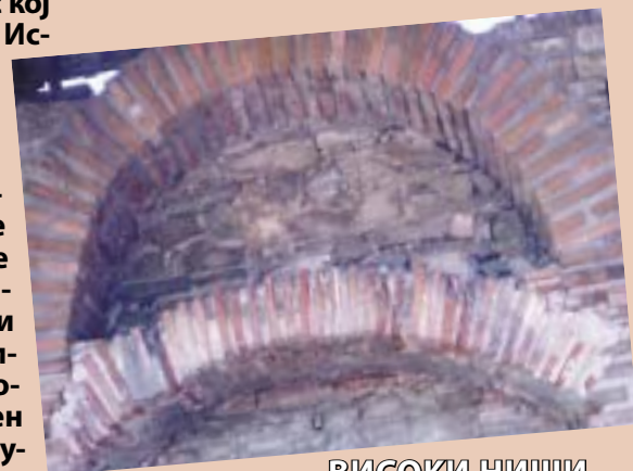
ВИСОКИ НИШИ КОИ ЗАВРШУВААТ СО АРКИ

Во III век згаснува функционирањето на Форумот, веројатно по наездата на Готите.