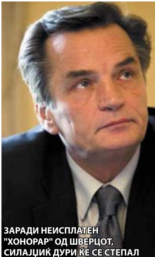
ЗАРАДИ НЕИСПЛАТЕН "ХОНОРАР" ОД ШВЕРЦОТ, СИЛАЈЦИК ДУРИ КЕ СЕ СТЕПАЛ

лесно изведената работа на западни фирми да прошверцуваат оружје од Босна и Косово преку Македонија во Ирак или во Авганистан.