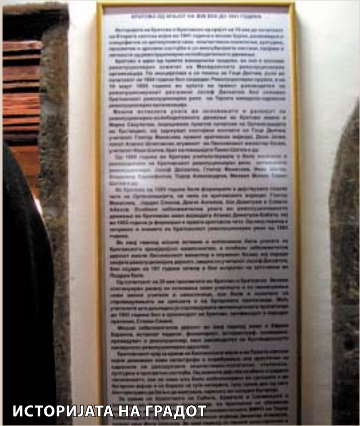
ИСТОРИЈАТА НА ГРАДОТ