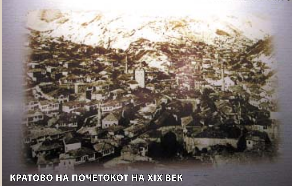
КРАТОВО НА ПОЧЕТОКОТ НА XIX ВЕК

предводено од бунтовниот кратовчанец Карпош. Просветата во Кратовско од почетокот на XIX век бележи значаен развој со многу училишта и учители. На изложбата е спомнат и достоинствениот