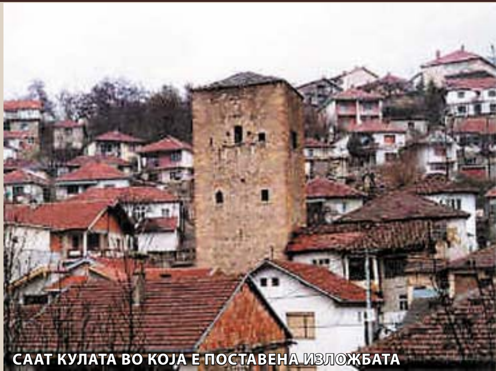
СААТ КУЛАТА ВО КОЈА Е ПОСТАВЕНА ИЗЛОЖБАТА