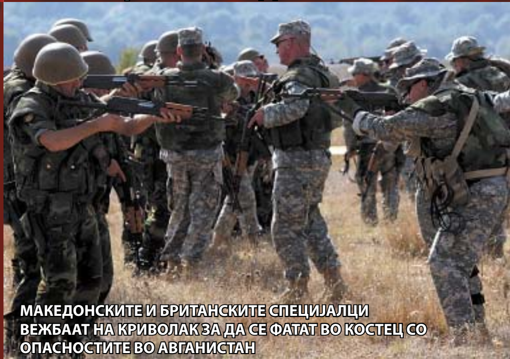
МАКЕДОНСКИТЕ И БРИТАНСКИТЕ СПЕЦИЈАЛЦИ ВЕЖБААТ НА КРИВОЛАК ЗА ДА СЕ ФАТАТ ВО КОСТЕЦ СО ОПАСНОСТИТЕ ВО АВГАНИСТАН

Овие прашања малку се елаборираат во јавноста, иако во регионот расте интересот за "кираџиските" услови, односно сè повеќе Хрватите, Србите и другите нации почнуваат многу потемелно да размислуваат за нивното влегување во Алијансата. Притоа, пресметале колку треба да дадат, а колку ќе изгубат, бидејќи коцкањето со НАТО е тешка работа.