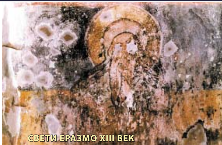
СВЕТИ ЕРАЗМО XIII ВЕК

риска. Живеел во III век, во времето на царевите Диоклецијан и Максимијан (284-385).