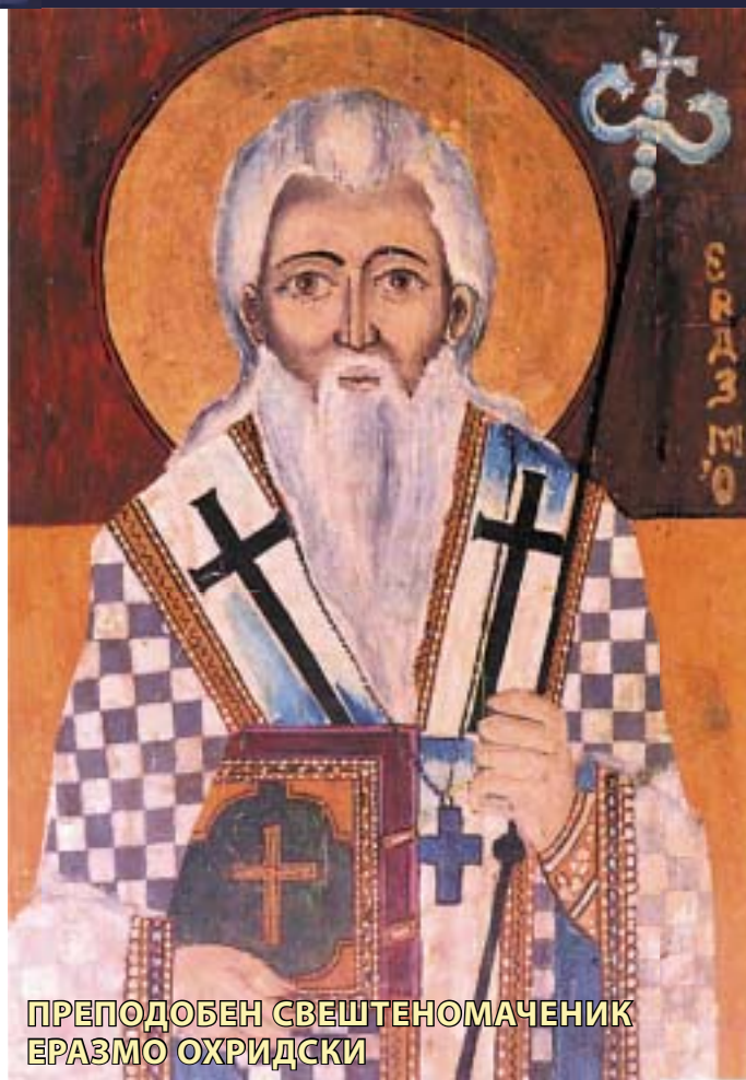
ПРЕПОДОБЕН СВЕШТЕНОМАЧЕНИК ЕРАЗМО ОХРИДСКИ

Во близина на Охрид (на патот Охрид-Струга), непосредно до северното крајбрежје на Охридското Езеро, се наоѓа пештерната црква, посветена на Свети Еразмо Охридски. Во неа живеел, се