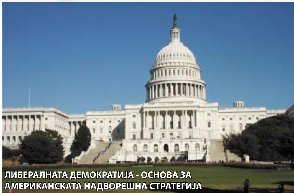
ЛИБЕРАЛНАТА ДЕМОКРАТИЈА - ОСНОВА ЗА АМЕРИКАНСКАТА НАДВОРЕШНА СТРАТЕГИЈА

Последниве неколку години американската стратегија за надворешна политика претрпе чести и радикални промени, незапамтени за било која друга држава. Се разбира, околностите кои се случуваат во светот, како и улогата на официјален Вашингтон, која ја има во светското општество им дава право на Американците да се прилагодуваат на состојбите и на потребите. Па, оттука досега Белата кука неколку пати предлагаше зголемување на воениот буџет за Ирак и за Авгани-