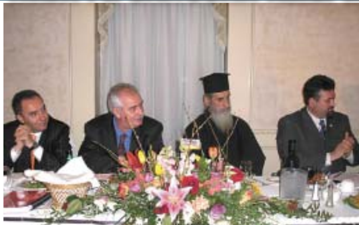
ОД ПОСЕТАТА НА МАКЕДОНСКАТА ДЕЛЕГАЦИЈА НА ДВИЖЕЊЕТО ЗА ЧОВЕКОВИ ПРАВА ВО КАНАДА

"Македонската православна црква треба да го следи примерот на Грчката, односно на Бугарската православна црква, кои триесеттина години, односно седумдесеттина години, беа под шизма. МПЦ треба само да чека. Таа не треба да прифаќа никаков разговор ако тие не сакаат да ни ја признаат црковната самостојност. Срамно е во XXI век проблемите да се решаваат со стари идеи, стари мисли. Република Македонија е самостојна држава и таа има право да има самостојна Црква, каква што е МПЦ", објаснува отец Царкњаз.