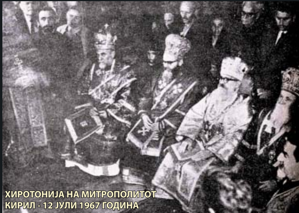
ХИРОТонија на митрополитот Кирил - 12 Јули 1967 година

За жал, Архијерејскиот собор на Српската православна црква, во мај 1966 година, одбил да ја претстави Македонската православна црква пред другите цркви.