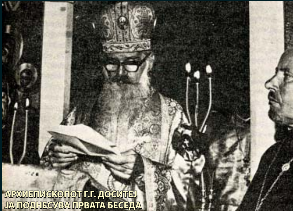
АРХИЕПИСКОПОТ Г.Г. ДОСИТЕЈ ЈА ПОДНЕСУВА ПРВАТА БЕСЕДА

кефални православни цркви. Единственото ограничување, доколку би можело така да се каже, се состоело само во пренесеното право на Врховниот поглавар да ја претставува самостојната Македонска православна црква пред другите цркви.