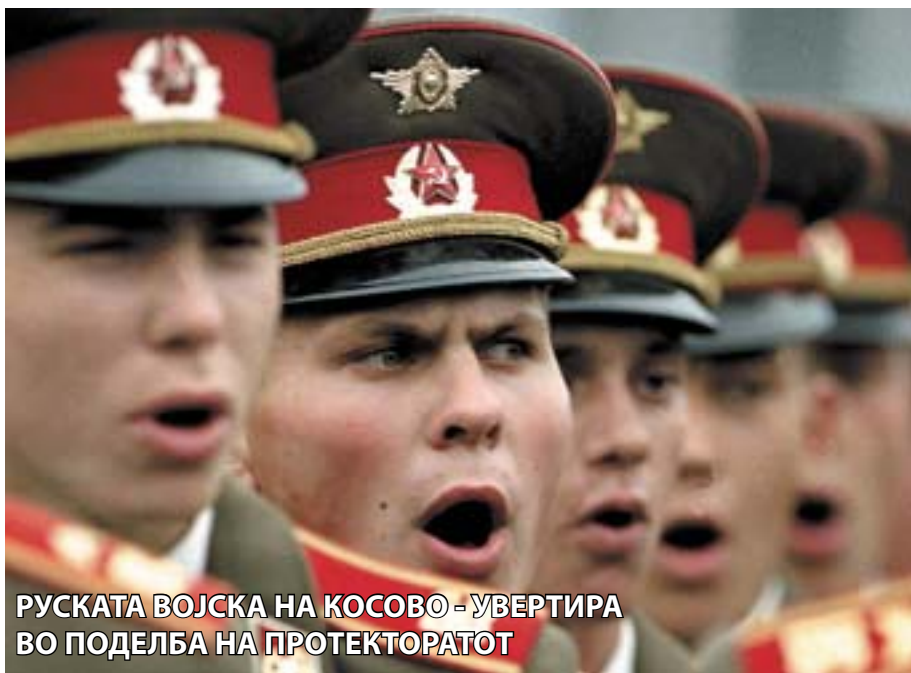
РУСКАТА ВОЈСКА НА КОСОВО - УВЕРТИРА ВО ПОДЕЛБА НА ПРОТЕКТОРАТОТ

Во кампот "Викторија", во близина на Приштина, припадниците на меѓународните сили и косовската полиција уништија 7.000 парчиња оружје од различен калибар кое беше запленето во изминатите неколку месеци. Претпоставките се дека на Косово во моментот има околу 400.000 парчиња огнено оружје, бомби и минофрлачи. Тоа е директна порака на сè почестите најави дека на Косово се подготвуваат нови нереди. Медиумите во Тирана со крупни наслови сè почесто коментираат во стилот: "Довидување до следната војна".