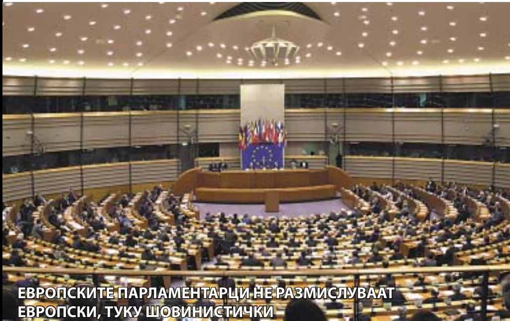
ЕВРОПСКИТЕ ПАРЛАМЕНТАРЦИ НЕ РАЗМИСЛУВААТ ЕВРОПСКИ, ТУКУ ШОВИНИСТИЧКИ