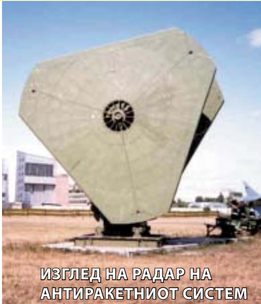
ИЗГЛЕД НА РАДАР НА АНТИРАКЕТНИОТ СИСТЕМ

договорот доколку и понатаму тој не се спроведува во практика. Таа оди уште подалеку со најавите дека соодветно ќе одговори на скапиот проект на Америка, но со далеку поскупо средство. Дали ќе ја задржи истата ефикасност како западниот систем е прашање кое треба да го разгледуваат воените аналитичари. Заканите и репликите кои почнаа да одат двонасочно, како да го навестуваат новиот почеток на студената војна. Нештата се обиде да ги избалансира и да ги ублажи генералниот секретар на Алијансата, Шефер, кој рече дека десеттина американски противракети на територијата на Европа, не претставуваат никаква опасност за Русија, која поседува стотици стратешки ракети и илјадници нуклеарни боеви глави. Но, веројатно Русија не се лаже со такви површни