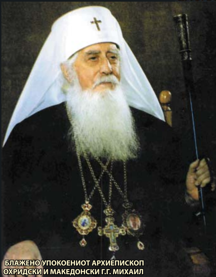
БЛАЖЕНО УПОКОЕНИОТ АРХИЕПИСКОП ОХРИДСКИ И МАКЕДОНСКИ Г.Г. МИХАИЛ

"Желбите и настојувањата за обновување на Охридската архиепископија тесно се поврзуваат со борбата за национална афирмација на македонскиот народ", констатирал блажено упокоениот Архиепископ Охридски и Македонски Г.Г. Михаил, кој во книгата "Нашето свето православие" се осврнал на неколку клучни прашања од историјата на МПЦ во XX век.