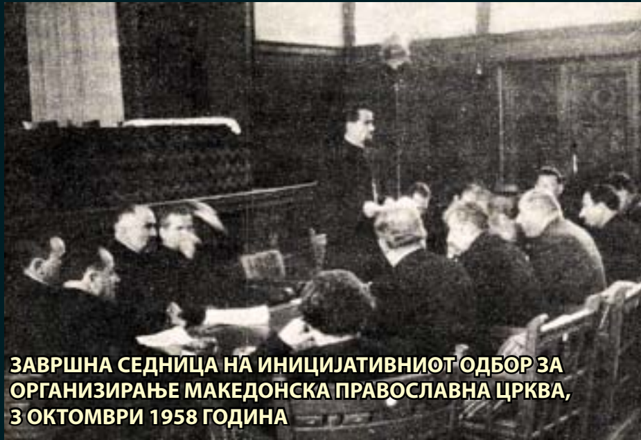
ЗАВРШНА СЕДНИЦА НА ИНИЦИЈАТИВНИОТ ОДБОР ЗА ОРГАНИЗИРАЊЕ МАКЕДОНСКА ПРАВОСЛАВНА ЦРКВА, 3 ОКТОМВРИ 1958 ГОДИНА

"Владејачките режими ги ангажирале православните цркви да им служат во