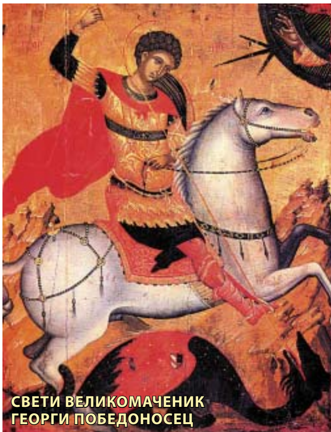
СВЕТИ ВЕЛИКОМАЧЕНИК ГЕОРГИ ПОБЕДОНОСЕЦ

Деновите се прославува големиот светител Свети Великомаченик Георгиј Победоносец. Се прославува неговата победа над злото, неговата вечност, која почна овде во времето живот, точно на 23 април по стар календар, кога тоа јуначко срце, по големи страдања, било пресечено со меч од сатанските раце на незнајбожец, а од Бога овенчан со венец на славата во 303 година. Се родил во Кападокија, област во Мала Азија. Бил син на побожни и богати родители. Татко му настрадал како маченик заради верата во Христа, и Свети Георгиј уште како дете останал сираче, без татко. Тогаш мајката со малиот Георгиј се пресе-