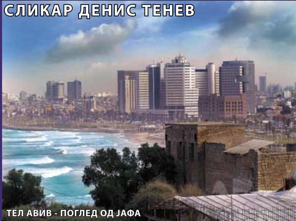
ТЕЛ АВИВ - ПОГЛЕД ОД ЈАФА