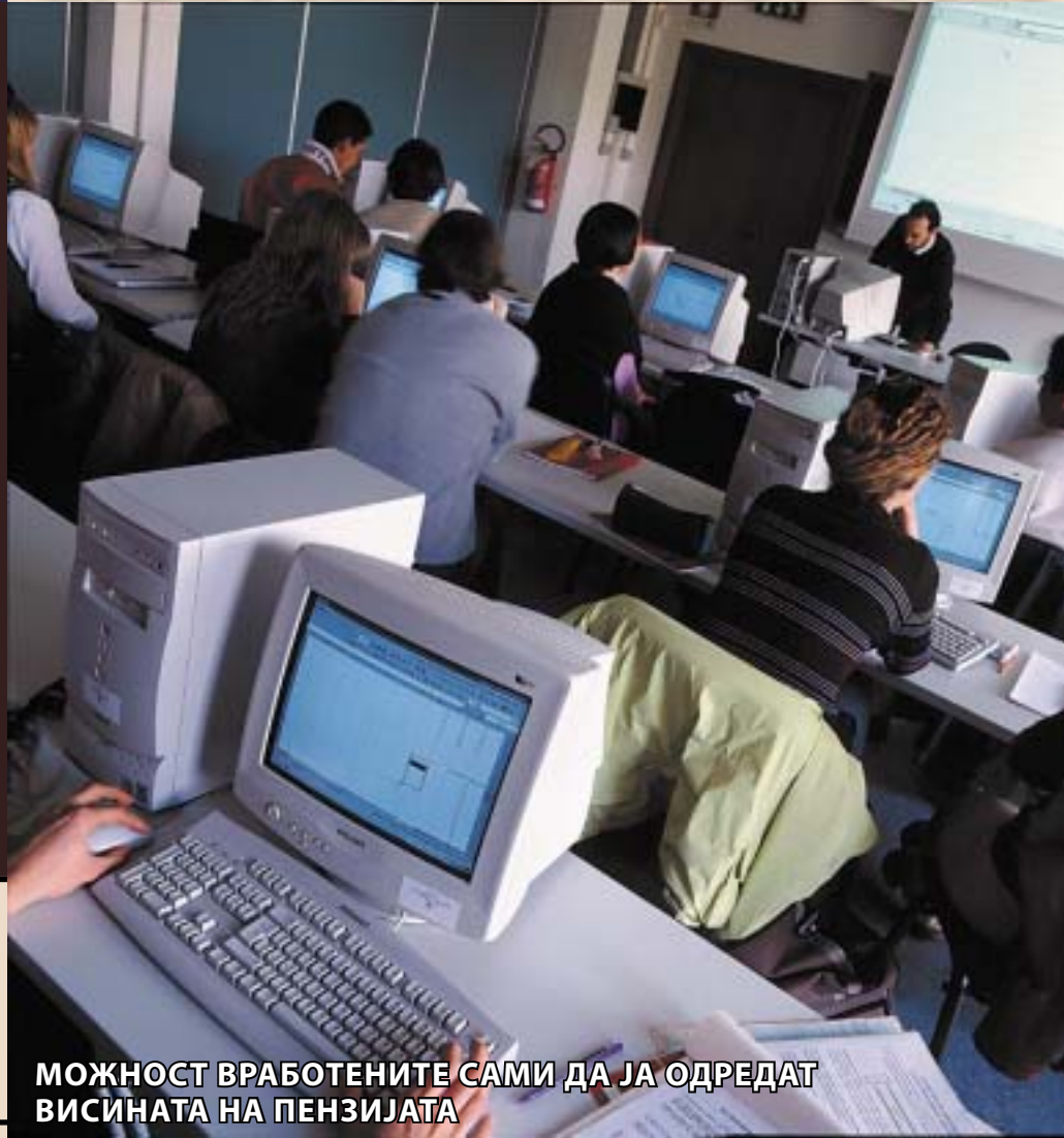
МОЖНОСТ ВРАБОТЕНИТЕ САМИ ДА ЈА ОДРЕДАТ ВИСИНАТА НА ПЕНЗИЈАТА

Доброволното пензиско осигурување, во кое осигурениците ќе можат да уплатуваат доколку сами одлучат, треба да стартува од јуни идната година. До крајот на годинава треба да бидат донесени сите неопходни законски прописи. Од Агенцијата за супервизија на капитално финансираното пензиско осигурување - МАПАС, велат дека овој Трет столб ќе биде можност за осигурениците повеќе да заштедат и да имаат повисок стандард по пензионирањето, а ќе им даде можност да уплатуваат за пензија и лицата кои не се вработени.