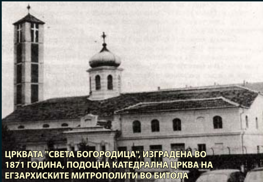
ЦРКВАТА "СВЕТА БОГОРОДИЦА", ИЗГРАДЕНА ВО 1871 ГОДИНА, ПОДОЦНА КАТЕДРАЛНА ЦРКВА НА ЕПАРХИСКИТЕ МИТРОПОЛИТИ ВО БИТОЛА

Всушност, тоа била првата победа на македонскиот народ во борбата за еманципација од Цариградската патријаршија и воопшто од елинизацијата, што имало огромно значење во натамошните црковно-будителски борби.