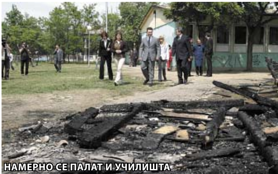
НАМЕРНО СЕ ПАЛАТ И УЧИЛИШТА

во училиштето "Јан Амос Коменски" во Скопје за кој постојат оправдани сомневања дека бил подметнат. Веднаш следуваше посета на училиштето од страна на премиерот Никола Груевски и новоделување средства за изградба на нова зграда, но засега не постојат никакви информации од преземената истрага, која треба да покаже дали можеби се работи за смислена и однапред орга-