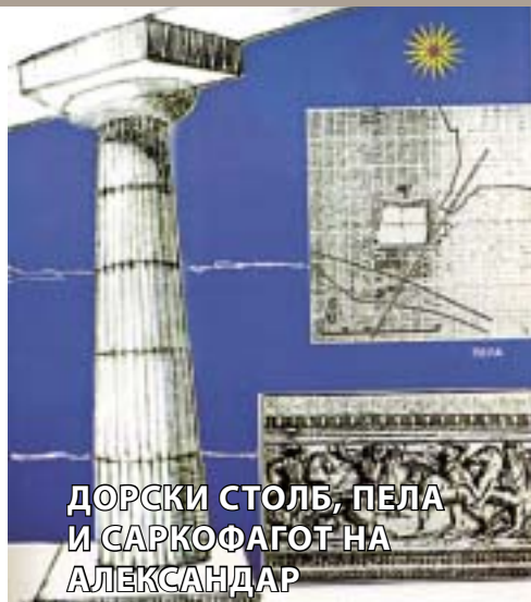
ДОРСКИ СТОЛБ, ПЕЛА И САРКОФАГОТ НА АЛЕКСАНДАР

Кралството на Антигоните во Македонија, Кралството на Селекуидите во Азија и Кралството на Птоломеите, кои владееле речиси 2-3 века на севкупното подрачје на Медитеранот и подалеку на исток до Индија. Тие се познати и со изградбата на нивните најголеми светски метрополи во тоа време, како што се, Пела, Вавилон во Азија и најголемата македонска метропола Александрија, град - ремек дело на класичниот македонски град, кој настанал како резултат на македонската урбанизација која датира од тој период, на сите три континенти".