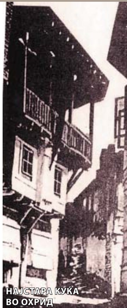
НАЈСТАРА КУЌА ВО ОХРИД