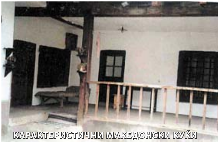
КАРАКТЕРИСТИЧНИ МАКЕДОНСКИ КУЌИ