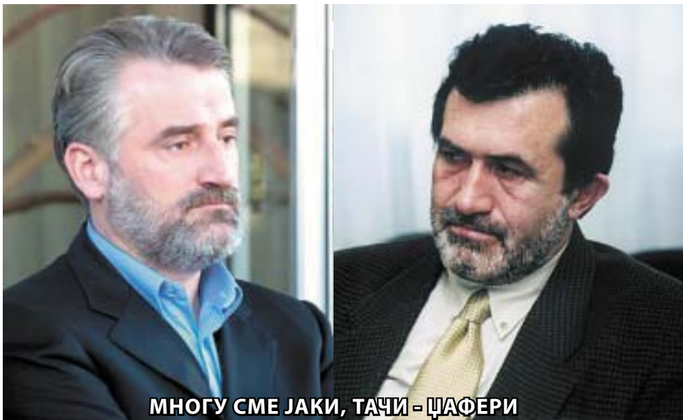
МНОГУ СМЕ ЈАКИ, ТАЧИ - ЦАФЕРИ

организации. ДПА ќе има контролирана поддршка од дипломатите, пред сè, од оние на САД, поради одредени заслуги во глобалната американска политика.