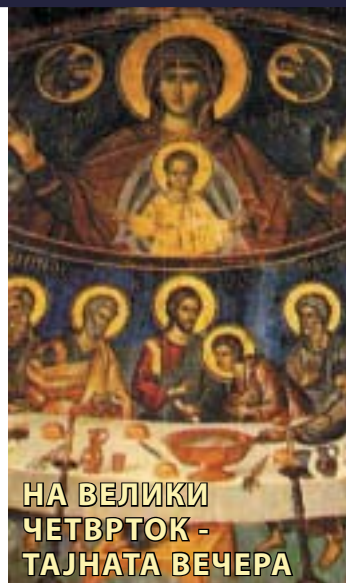
НА ВЕЛИКИ ЧЕТВРТОК - ТАЈНАТА ВЕЧЕРА