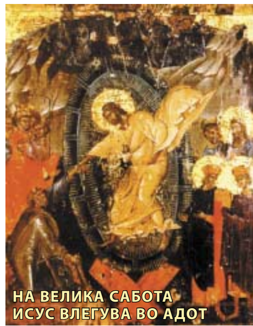
НА ВЕЛИКА САБОТА ИСУС ВЛЕГУВА ВО АД

На Велики петок се случува најстрашното: мачење, распнување, умирање на Крст. Некои неблагодарни луѓе како да ги забораваја Неговите чуда: слепи прогледуваа, глуви прослушуваа, хроми проодуваа, мртви воскреснуваа. Незнајбожните луѓе докажале дека ги сакаат желбите на својата огревова, распана волја и гласно викале: "Расни Го, распни Го, распни Го!" Лажните обвиненија од беззаконите сведоци: "Исус е безбожник, Исус е бунтовник, Исус е непријател на законот, Исус себе си лажно се нарече дека е Син Божји, Исус