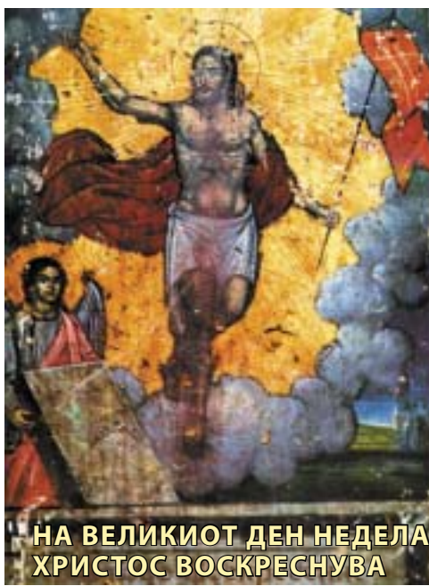
НА ВЕЛИКИОТ ДЕН НЕДЕЛА ХРИСТОС ВОСКРЕСНУВА

а моите блиски, кои стоеја покрај крстот, не смееја да ми помогнат. Во тој час, толку ми беше тешко, што од длабочината на душата морав да воздивнам, и не можев а да не извикам кон Мојот Татко - Боже мој, Боже мој, зошто ме остави?" Христос бил распнат на Крстот меѓу двајца злосторници. Околу Него стоела Марија Мајка Му Богородица и верниот Христов ученик Свети Јован Богослов. Крвавело мајчино срце, секоја болка на Синот ја чувствувало. Оддалеку гледале Марија Магдалена и Марија, мајката на Јаков и Јосиф и мајката на Заведеевите синови и други. Околу шесттиот, па сè до деветтиот