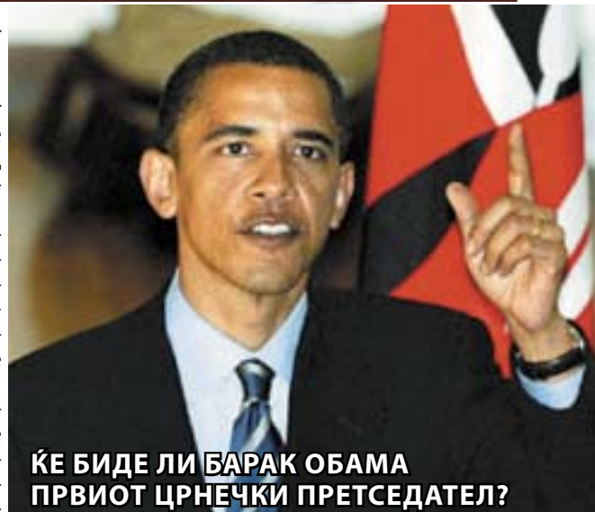
ЌЕ БИДЕ ЛИ БАРАК ОБАМА ПРВИОТ ЦРНЕЧКИ ПРЕТСЕДАТЕЛ?

Меѓутоа, како далеку посериозен кандидат на републиканците се смета