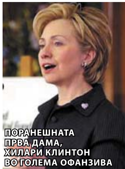
ПОРАНЕШНАТА ПРВА ДАМА, ХИЛАРИ КЛИНТОН ВО ГОЛЕМА ОФАНЗИВА

Кандидатурата на црнечкиот сенатор од Илионис, Барак Обама, кој со долги чекори напредува во својата политичка кариера, исто така, е големо изненадување, иако се смета дека тој не ќе може да ѝ се спротивстави на конзервативната Америка, која сè уште не може да преземе таков радикален пресврт. Можеби таквиот факт влијаеше и врз одлуката на Колин Паул, популарниот американски државен секретар и командант на силите на првата американска воена интервенција против Ирак во 1991 година, во време на владеењето на таткото на актуелниот американски претседател Џорџ Буш, кој во периодот на својата најголема популарност не сакаше ниту да помисли на таква кандидатура. Затоа многу аналитичари сметаат дека е малку реално дека тоа ќе успее да го постигне младиот црнечки лидер и сенатор Барак Обама.