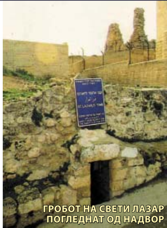
ГРОБОТ НА СВЕТИ ЛАЗАР ПОГЛЕДНАТ ОД НАДВОР

Гласот за воскресението на Лазар се пренел во Светиот град Ерусалим. Следниот ден Исус Христос влегол во Ерусалим. Но, овој пат не како непознат странец. По него оделе многу луѓе од Витанија за да посведочат за вистината. Во Ерусалим бил пречекан најсвечено. Седнат на ослето, скромно и мирно, влегол во градот. Луѓето