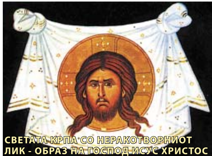
СВЕТАТА КРПА СО НЕРАКОТВОРНИОТ ЛИК - ОБРАЗ НА ГОСПОД ИСУС ХРИСТОС

смрт. Тоа е најголемиот бунт во историјата на човештвото, и најголемиот грев на небото и на земјата. Оваа химна е најкомплексна и најобемна поетска форма во црковната химнографија, станува инспирација за нејзиното ликовно прикажување во уметноста. Првиот Акатист е составен во слава и чест на Пресвета Богородица. Негови можни автори се: Јоан Дамаскин, Роман Слаткопеец, Патријархот Сергеј, Патријархот Фотиј и