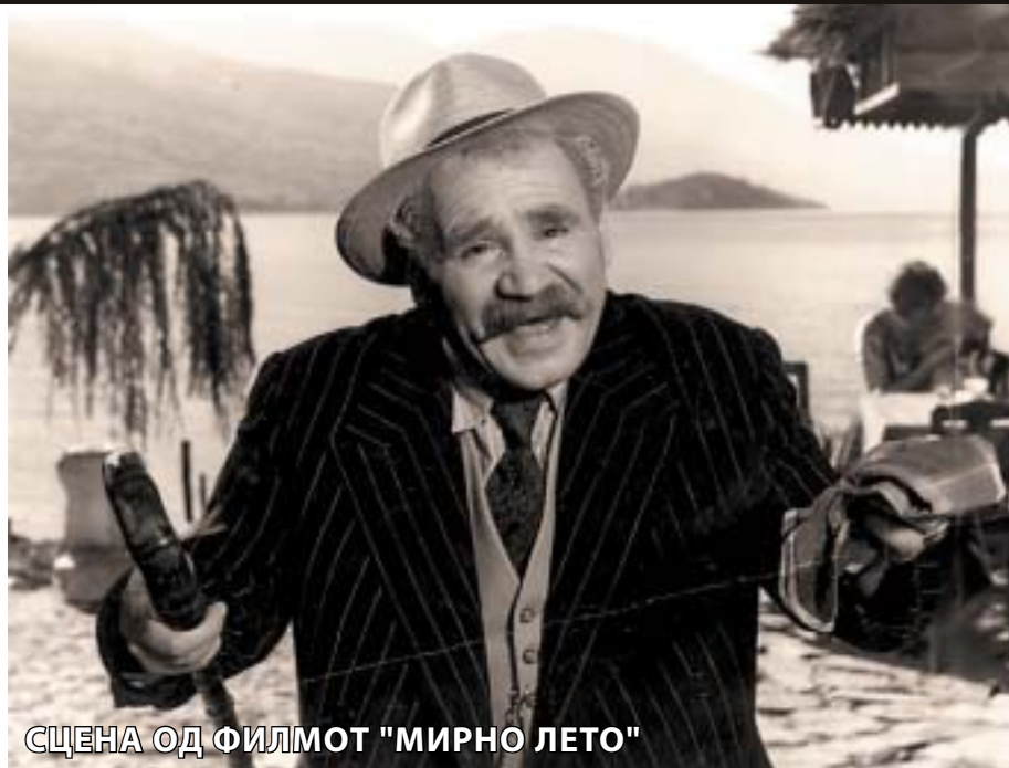
СЦЕНА ОД ФИЛМОТ "МИРНО ЛЕТО"