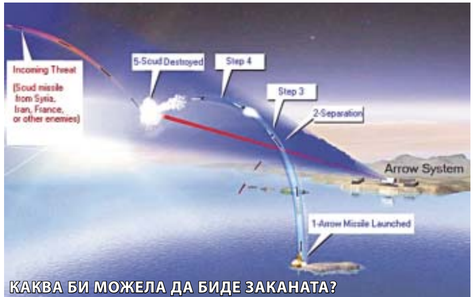
КАКВА БИ МОЖЕЛА ДА БИДЕ ЗАКАНАТА?

В о услови кога светот повторно зоврива со неколку кризни подрачја, големите сили се впуштаат во нов поход на вооружување. Сојузниците стравуваат едни од други. Во услови на сеопшта војна на планетата веројатно нема да се знае кој против кого ќе биде. Договор е веројатно да се предупредува само на опасноста од Иран или од Северна Кореја. Западната и источната хемисфера имаат многу поголеми предизвици од заканите на Техеран или на Пјонг Јанг. Машинериите повторно ги пуштија турбините во погон. Всушност, најголемата битка за превласт повторно ќе се води меѓу Вашингтон и Москва, како вечни ривали на геополитичката