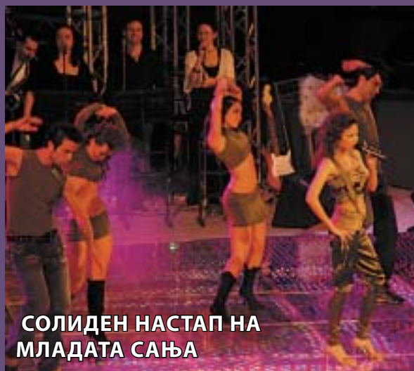
СОЛИДЕН НАСТАП НА МЛАДАТА САЊА