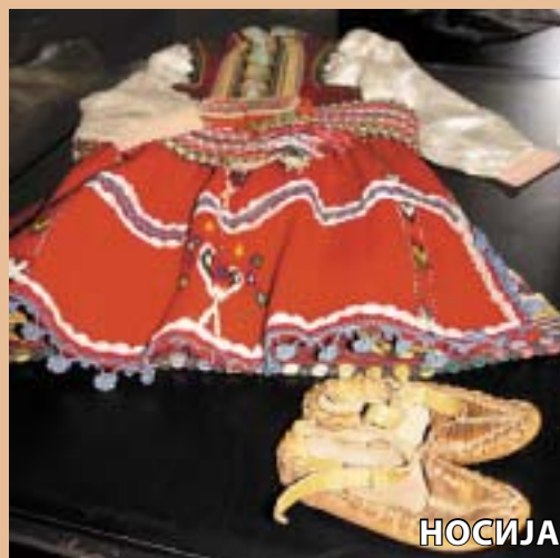
НОСИЈА И ГРАДСКА ОБЛЕКА

постарите, пресоблекувањето во народни носии, во облека од претходните генерации или во ромски алишта, како и обичајот наречен амкање варено јајце или растеглива алва. Празнувањето на Прочка со голем семеен ручек, маскирање и амкање било најизразено меѓу двете светски војни, а потоа комунистичкиот, атеистички режим празникот го свел на минимум. Последниве десетина години повторно се забележува