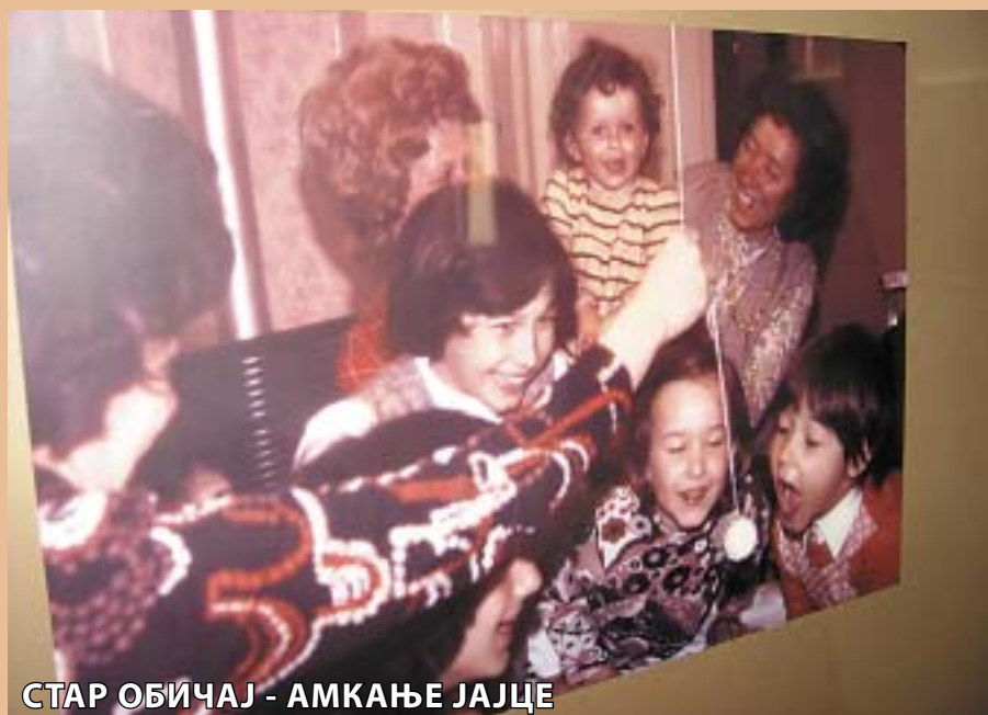
СТАР ОБИЧАЈ - АМКАЊЕ ЈАЈЦЕ