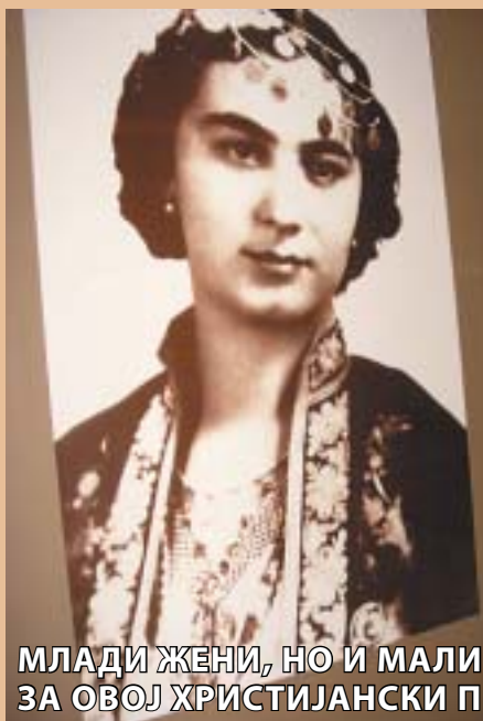
МЛАДИ ЖЕНИ, НО И МАЛИ ДЕЦА СЕ ПРЕОБЛЕКУВАЛЕ ЗА ОВОЈ ХРИСТИЈАНСКИ ПРАЗНИК