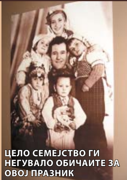
ЦЕЛО СЕМЕЈСТВО ГИ НЕГУВАЛО ОБИЧАИТЕ ЗА ОВОЈ ПРАЗНИК

да се фотографираат кај професионални фотографи, па така на седумдесетина фотографии се гледаат деца и возрасни облечени во народни носии, во облека која се зачувала од предците, но и се позајмувала од околните села и од ромските семејства. Преку изложените фотографии и неколкуте парчиња облека се следат духот и обичаите за празнувањето на Прочка, како што е барањето прошка на помладите од