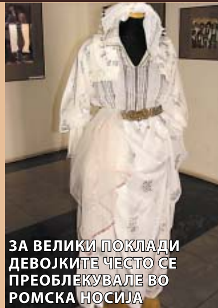
ЗА ВЕЛИКИ ПОКЛАДИ ДЕВОЈКИТЕ ЧЕСТО СЕ ПРЕОБЛЕКУВАЛЕ ВО РОМСКА НОСИЈА