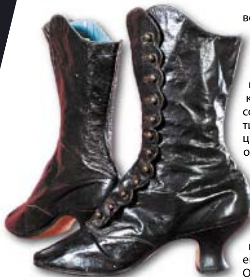
МОДЕЛ НА ЧИЗМИ КОИ МОЖАТ И ДЕНЕС ДА СЕ НОСАТ КАКО МОДЕН ТРЕНД