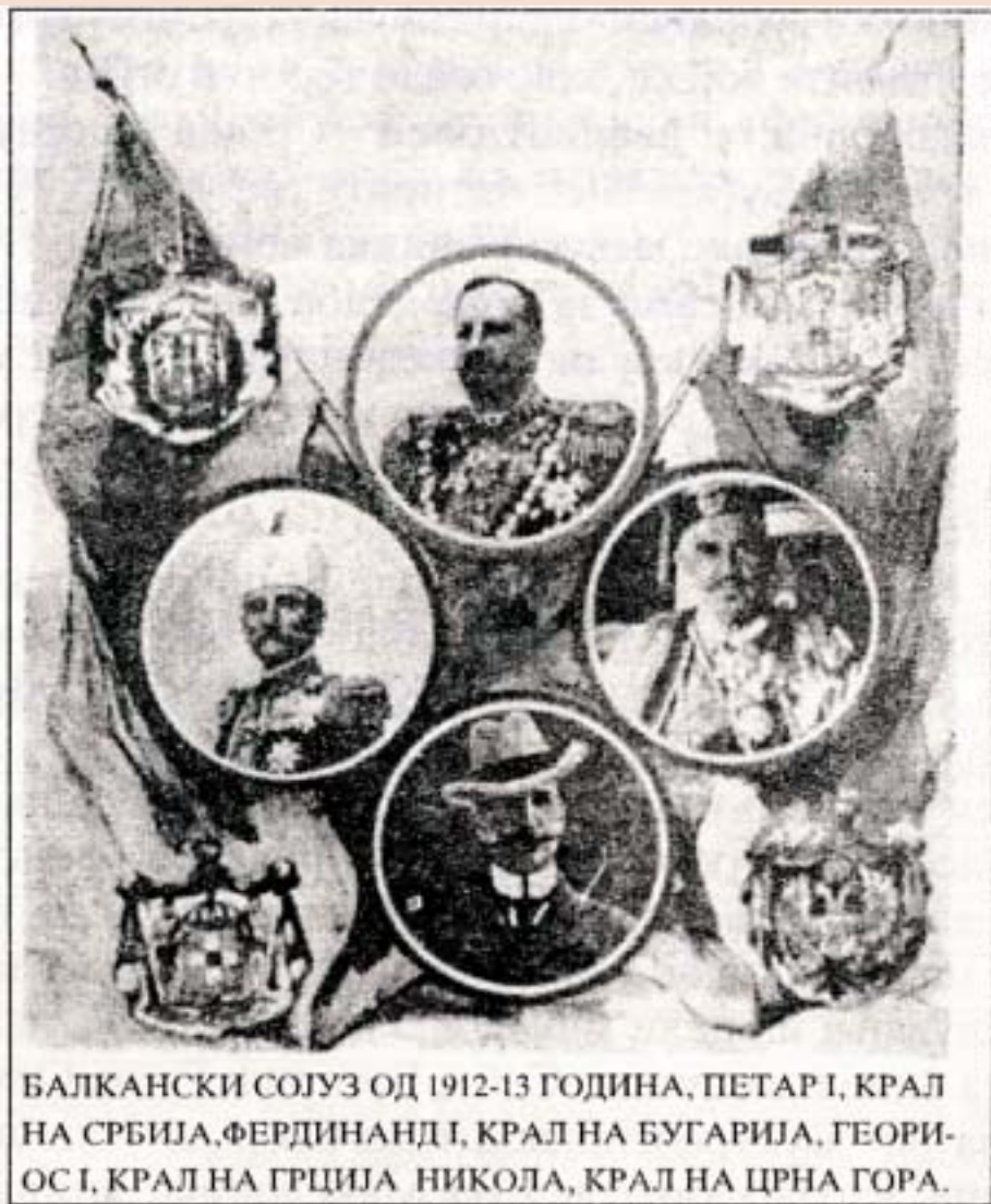
БАЛКАНСКИ СОЈУЗ ОД 1912-13 ГОДИНА, ПЕТАР I, КРАЛ НА СРБИЈА, ФЕРДИНАНД I, КРАЛ НА БУГАРИЈА, ГЕОРИОС I, КРАЛ НА ГРЦИЈА, НИКОЛА, КРАЛ НА ЦРНА ГОРА.

П о долготрајна јавна и тајна дипломатско-политичка игра, протезирана од Русија и од Австро-Унгарија против Турција, меѓу 13 март и 18 октомври 1912 година, беше склучен четворен Балкански сојуз против Турција меѓу Србија, Бугарија, Грција и Цр-