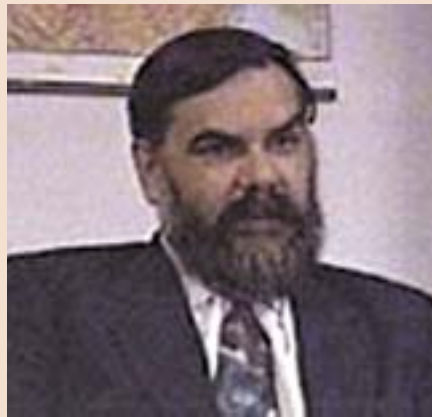
СТЕВО ЦРВЕНКОВСКИ (9.2.1993-6.7.1993) (ПОТПРЕТСЕДАТЕЛ НА ВЛАДА И ВРШИТЕЛ НА РАБОТИТЕ МИНИСТЕР ЗА НАДВОРЕШНИ РАБОТИ) (6.7.1993-23.2.1996)