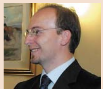
АНТОНИО МИЛОШОСКИ (АКТУЕЛЕН МИНИСТЕР ЗА НАДВОРЕШНИ РАБОТИ НА РМ)

Дипломатијата на Република Македонија има остварено исклучително голем број значајни активности во меѓународната заедница. Сите тие се резултат на новата глобална концепција на самостојната надворешна политика на македонската држава. Нејзината