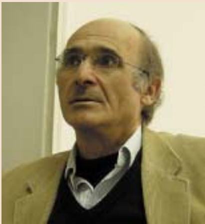
Д-Р ДЕНКО МАЛЕСКИ (20.3.1991- 9.2.1993)