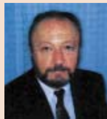
Од книгата на Пандил КОСТУРСКИ