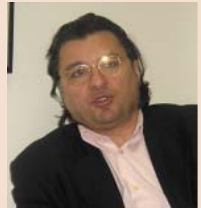
Д-Р ЛЉБОМИР ФРЧКОСКИ (23.2.1996-29.5.1997)