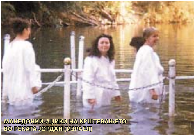
МАКЕДОНКИ-АЦИКИ НА КРШТЕВАЊЕТО ВО РЕКАТА ЈОРДАН (ИЗРАЕЛ)