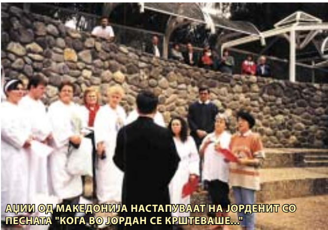
АЦИИ ОД МАКЕДОНИЈА НАСТАПУВААТ НА ЈОРДЕНИТ СО ПЕСНАТА "КОГА ВО ЈОРДАН СЕ КРШТЕВАШЕ..."

во Стариот Завет, а само се навестувала. Отецот се јавил со својот глас, со чувството на слухот да слушне светот и да поверува. Духот се јавил во вид на гулаб, со чувство на