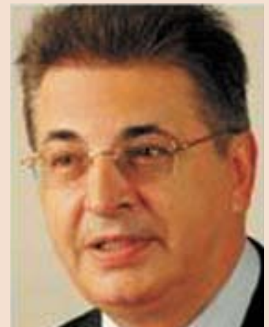
Д-Р СРЃАН КЕРИМ (30.11.2000-13.5. 2001)