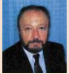
Од книгата на Пандил КОСТУРСКИ