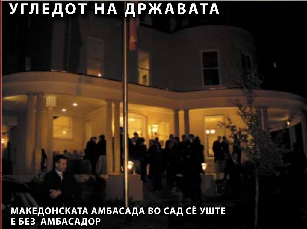
МАКЕДОНСКАТА АМБАСАДА ВО САД СÈ УШТЕ Е БЕЗ АМБАСАДОР

Како и да е, факт е дека по последното (во изминатиот период односите меѓу нив и не беа баш којзнае колку топли), заладување на односите меѓу Црвенковски и Груевски, кон крајот на 2006 година, кога целата Влада го бојкотираше неговото годишно обраќање, тешко ќе оди договарањето на оваа лис-