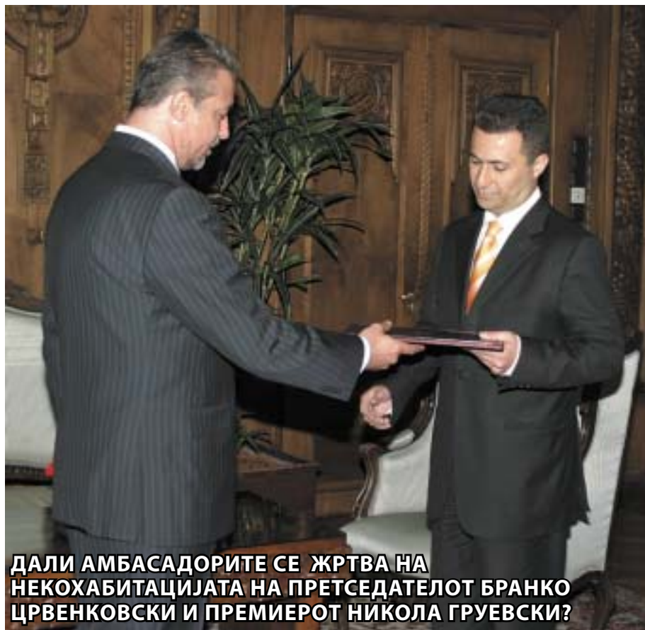
ДАЛИ АМБАСАДОРИТЕ СЕ ЖРТВА НА НЕКОХАБИТАЦИЈАТА НА ПРЕТСЕДАТЕЛОТ БРАНКО ЦРВЕНКОВСКИ И ПРЕМИЕРОТ НИКОЛА ГРУЕВСКИ?

"Дефинитивно немам намера да имам било какво влијание во СДСМ, за да се водам од тие емоции. И втора работа, кога би имал, а немам, Владо Бучковски не може да предизвика никакви проблеми", изјави Бранко Црвенковски во интервјуто за телевизијата Канал 5.