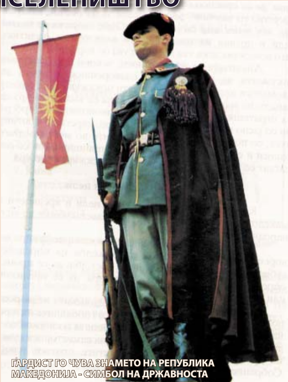
ГАРДИСТ ГО ЧУВА ЗНАМЕТО НА РЕПУБЛИКА МАКЕДОНИЈА - СИМБОЛ НА ДРЖАВНОСТА