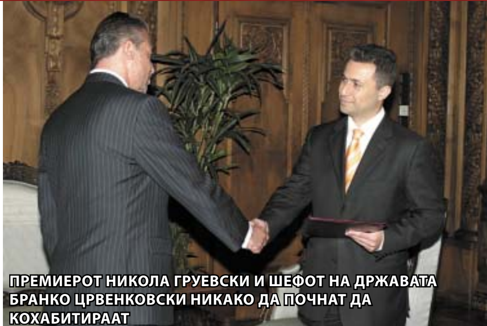
ПРЕМИЕРОТ НИКОЛА ГРУЕВСКИ И ШЕФОТ НА ДРЖАВАТА БРАНКО ЦРВЕНКОВСКИ НИКАКО ДА ПОЧНАТ ДА КОХАБИТИРААТ

Генерално, ова е сликата за политичката состојба во земјава, за која може сло-