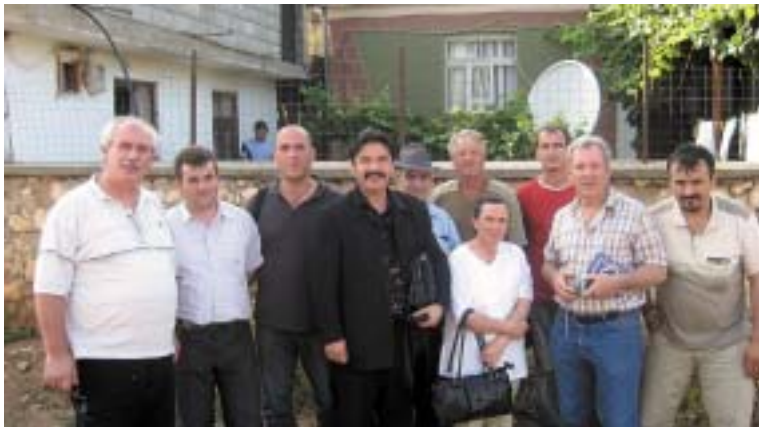
ОД ПОСЕТАТА НА МАЛА ПРЕСПА

На почетокот на декември, иако легално поставени од Советот на Општината, четири табли на македонски јазик за добредојде и довидување во Пустец, Мала Преспа, беа урнати со асистенција на албанската полиција. Партијата на Македонците во Албанија - Македонска алијанса за европска интеграција е сериозен кандидат да добие градоначалничко место во Пустец и затоа притисоците растат. Македонците