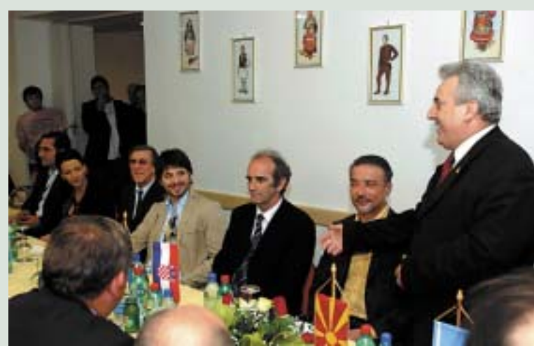
БРАНКО ЦРВЕНКОВСКИ НА СРЕДБА СО МАКЕДОНЦИТЕ ВО ХРВАТСКА

од Мала Преспа стравуваат дека во процесот на денационализација државата ќе им одземе земјиште за да им го додели на Албанците. Станува збор за околу 70 хектари вишок, утврден од албанската Централната државна комисија за распределба на земјиштето.