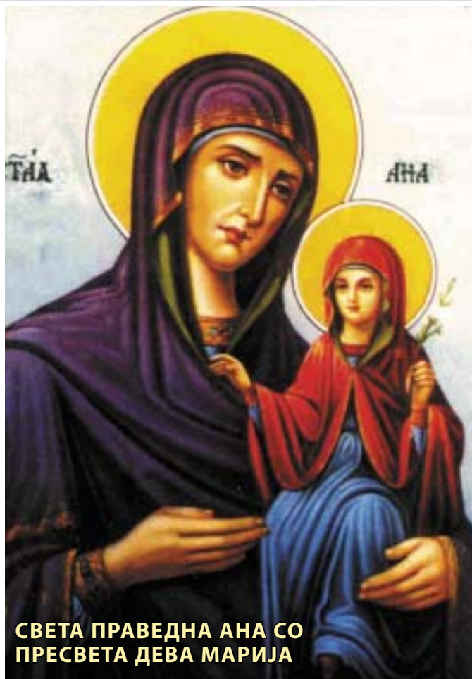
СВЕТА ПРАВЕДНА АНА СО ПРЕСВЕТА ДЕВА МАРИЈА

Светата Црква го празнува зачнувањето на Пресвета Дева и пее: "Сега Ана зачна да го негува божествениот честак - Богородица, која ќе го роди Христа, Создателот на целиот