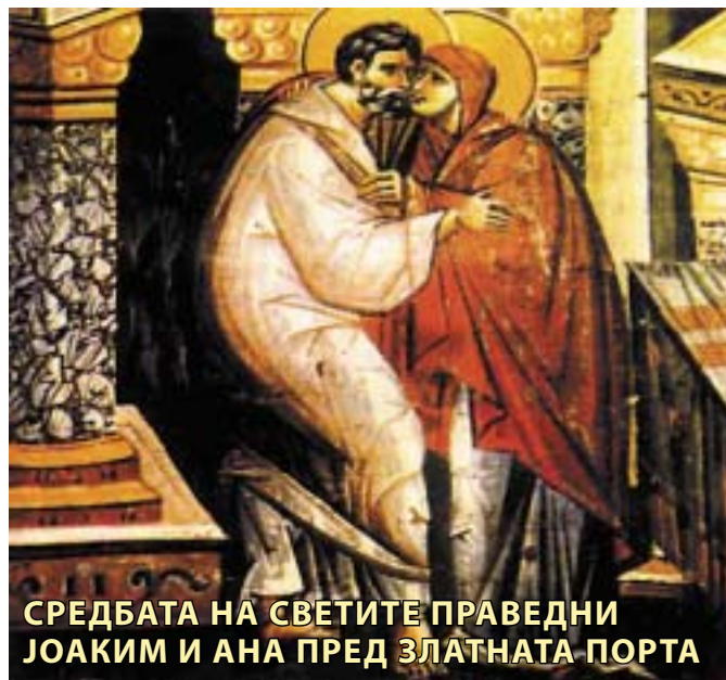
СРЕДБАТА НА СВЕТИТЕ ПРАВЕДНИ ЈОАКИМ И АНА ПРЕД ЗЛАТНАТА ПОРТА

"Господе, Ти Кој ѝ даде син на Сара во староста, Кој ѝ даде на Ана да го роди твојот пророк Самуил, погледни на мене и одврзи ме од врската на неротка. И она дете, кое би го родила, ќе Ти го принесам Тебе на дар, за да се слави преку него Твоето милосрдие", такви молитви упатуваше кон Бога жалната душа на Ана, идната мајка на Богородица. Ана ги изговорила овие зборови и веднаш ѝ се јавил Божји ангел